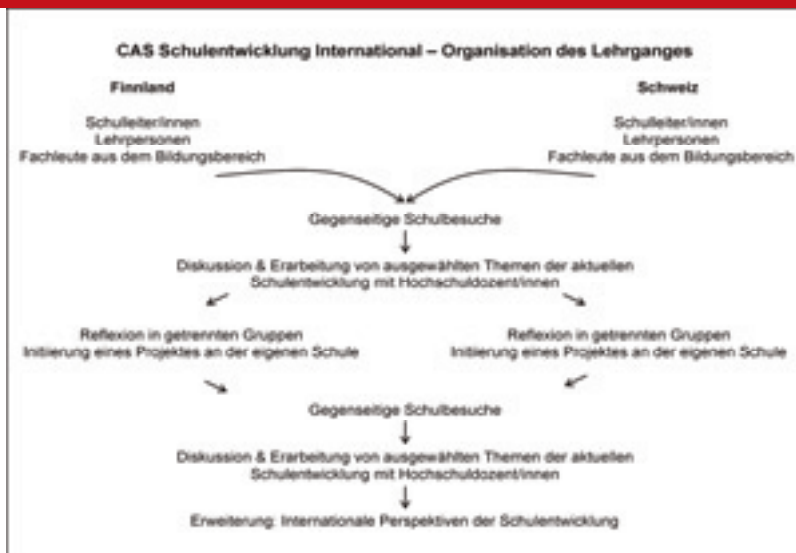
Abb. 2: Organisation des CAS Schulentwicklung International

Halbjahr zunächst gegenseitig im Unterricht in Finnland. Die hier gewonnenen Eindrücke werden mit Hilfe von Hochschuldozierenden in anschließenden Workshops aufgegriffen und vertieft.