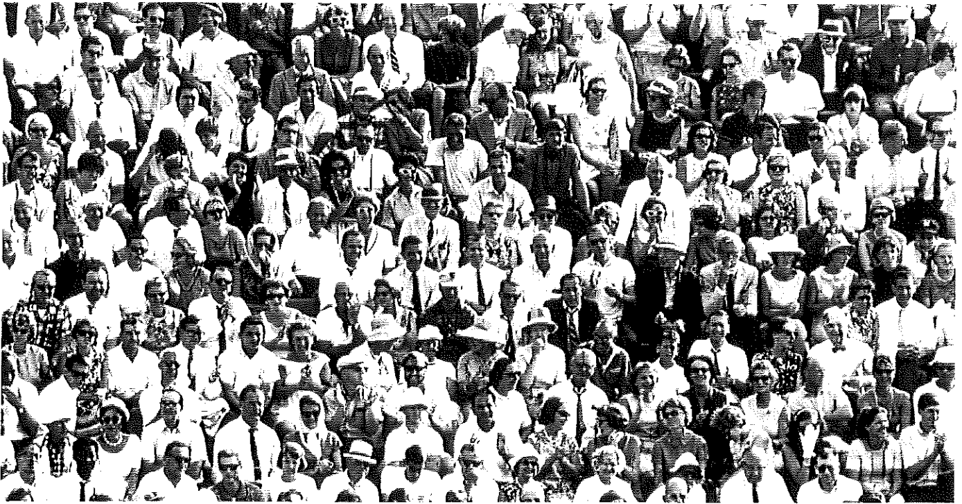
Ist Angst vor Menschenmengen vielleicht ganz einfach mit Angst vor Menschen gleichzusetzen?

Handeln ja auch unangenehme oder sogar bedrohliche Konsequenzen haben kann. Im Berufsalltag kann man Angst verspüren, einen schwierigen und wichtigen Kunden nicht zufriedenzustellen. Diese Angst muss nicht nur negativ gesehen werden. In diesem Fall kann das auch stimulierend wirken,