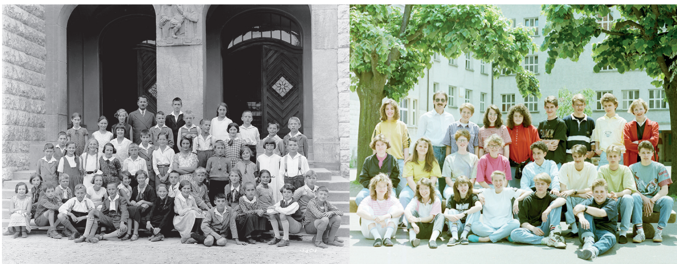
Alte und uralte Erinnerungen: Klassenfotos von Schulklassen aus Dietikon aus den Jahren 1932 (Abb. 1) und 1990 (Abb. 2).