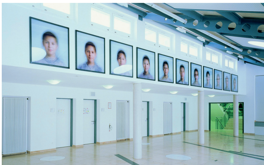
Durchschnittsgesichter: Einzelne Porträts von Kindern wurden übereinander gelegt. Ausstellung im Rahmen des Kunst-am-Bau-Programms QUIVID in München (Abb. 4).